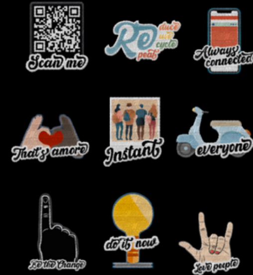
Patch to fix